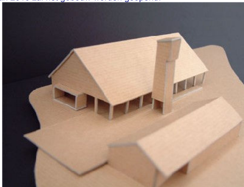
(ontwerp/foto De Velde architecten)

Wie nu gaat kijken op de plek waar het centrum moet worden gebouwd, treft nog een modderige plek aan de Lange Kolk aan, maar dit voorjaar moet de bouw starten en in de tweede helft van 2010 zal het gebouw worden geopend.